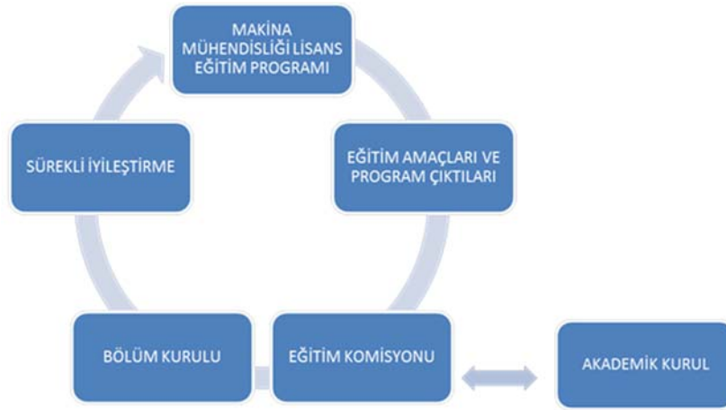
Şekil C6.1. Makina Mühendisliği Bölümü özelinde eğitim planı iyileştirme sistemi

MÜDEK Akreditasyonu bulunan bölümlerde programların güncellenmesi ve sürekli iyileştirilmesi sistemi “Makina Mühendisliği” bölümü için aşağıdaki şemada belirtildiği gibi gerçekleşmektedir. Eğitim planında yapılan değişiklikler bir sonraki yılın Nisan ayı içerisinde senatoya sunularak kabulü sonrasında öğrenci işleri ve bilgi işlem daire başkanlığı tarafından yürürlüğe konmaktadır.